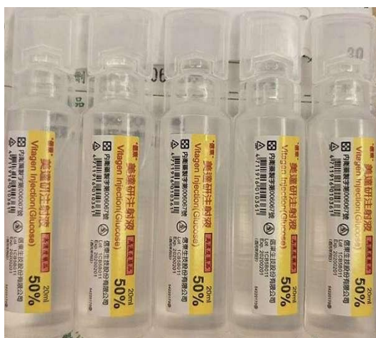
7.5 瓶倒入杯子或瓶子中