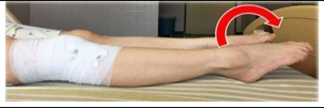
足踝幫浦運動-腳背往下