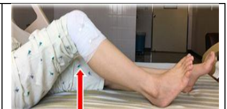
膝關節屈曲及 伸直運動