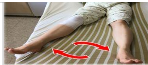
髖關節外展及 內收運動