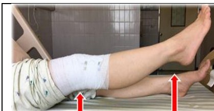
腿部伸直抬高運動