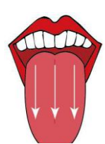
7. 刷舌頭， 由內往外 輕刷三下