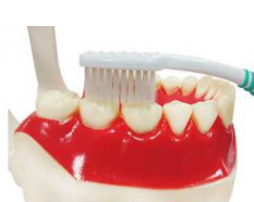
5. 咬合面每 兩顆牙齒 刷 10 下