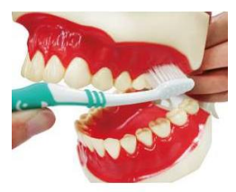
4. 按照順序 每兩顆牙 齒刷 10 下