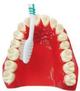
4. 接著刷內 側面 45 度