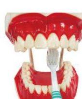
6. 內側前牙 可以把牙 刷握直刷