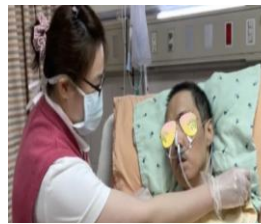
2. 床頭搖高 30 度