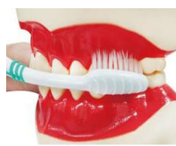
3. 牙刷呈 45 度，輕放 於牙齦溝