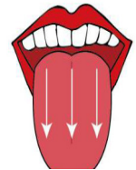
7. 刷舌頭， 由內往外 輕刷三下