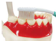
5. 咬合面每 兩顆牙齒 刷 10 下