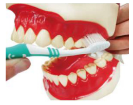
4. 按照順序 每兩顆牙 齒刷 10 下