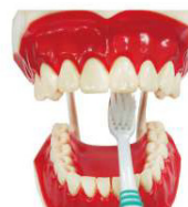
6. 內側前牙 可以把牙 刷握直刷