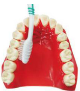
4. 接著刷內 側面 45 度