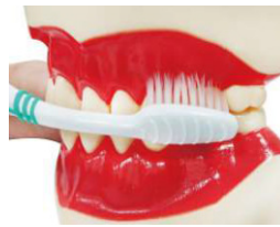
3. 牙刷呈 45 度，輕放 於牙齦溝