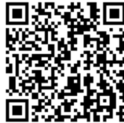
聖保祿醫院衛教單張網頁 QR Code

A：半身麻醉的針是刺入兩節腰椎骨之間，周圍主要是軟組織，如肌肉、韌帶、脂肪等，所以麻醉後可能有類似肌肉注射的局部輕微腫痛，通常 1-2 天後即可恢復，並不會造成腰痛的後遺症。