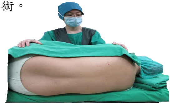
兩手抱膝、頭看肚臍、 身體彎曲成蝦米狀

麻醉醫師消毒皮膚後，使用如針灸般細的針，注射麻醉藥至脊髓液中，則下半身暫時失去知覺及痛覺，即可由手術醫師進行手術。